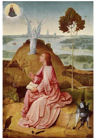
Johannes de Evangelist op Patmos Jheronimus Bosch, 1489-1499

3. De paarden draven door de lucht ontdaan van alle kleuren. Het mensdom lijdt en kermt en zucht totdat de wolken scheuren, de hemel op de aarde daalt en eind'loos licht ons overstraalt. Laat dat toch gauw gebeuren!